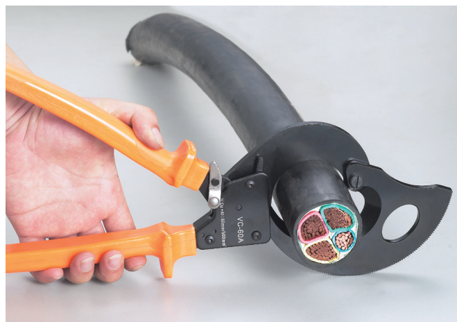
棘轮功能及两级棘轮传动，轻松剪切