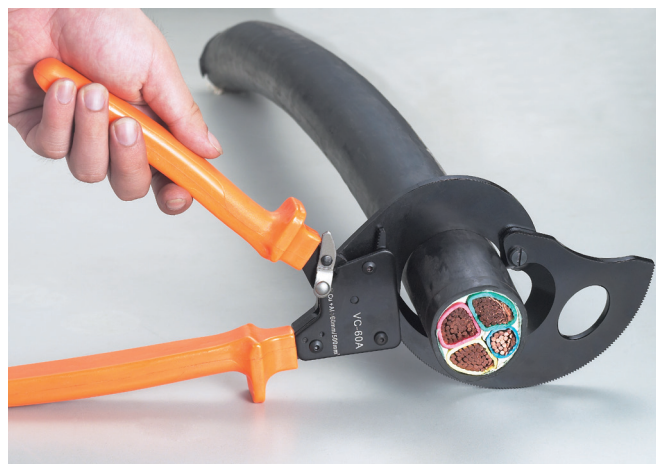
单手剪切时，可将手柄凸出位置固定在平面上，往下按压另一个手柄即可。